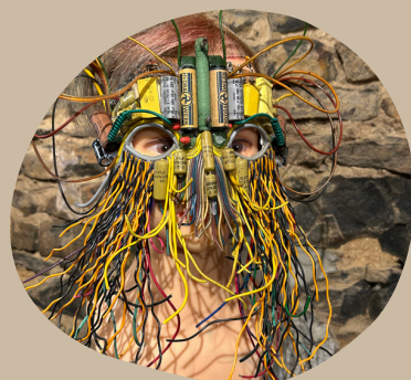
Oeuvre d'art, Utopia Tournai