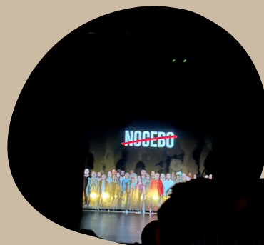
Spectacle "Nocebo", maison de la culture de Tournai