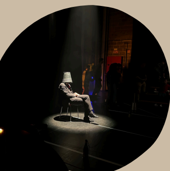
Spectacles de La Piste Aux Espoirs