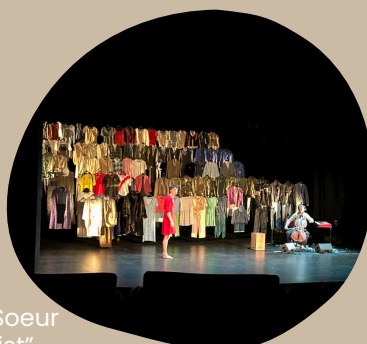
Spectacle "La Soeur de Jésus-Christ", maison de la culture de Tournai