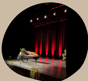
Concert d'un pianiste, à l'occasion du concours André Dumortier (mon arrière grand-père)