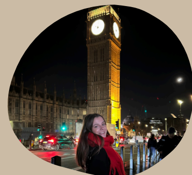
Voyage à Londres, car oui, voyager c'est de la culture.